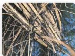
褐飛蝨群聚於叢基部