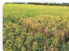
飛蝨嚴重危害水稻(穀地)