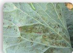
十字花科葉菜類蚜蟲